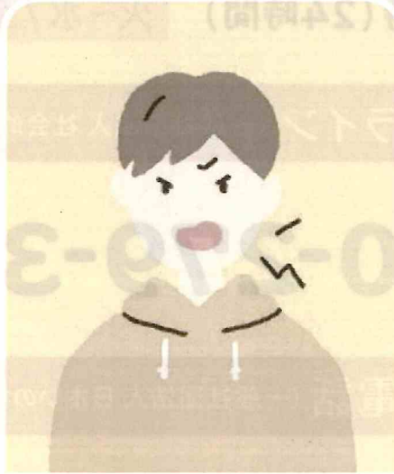
怒りやすくなった